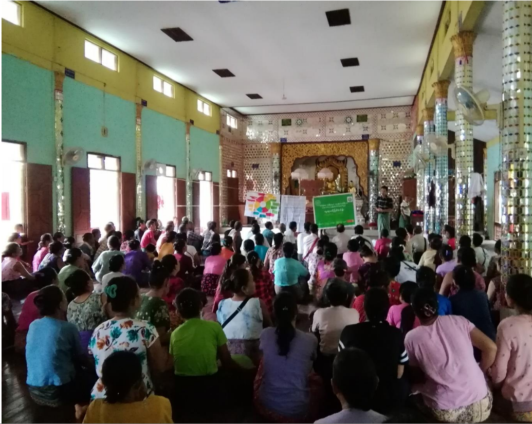
၉။ ကျေးရွာစီမံခန့်ခွဲရေးအဖွဲ့၏ အဖွဲ့ဝင်များစာရင်း။